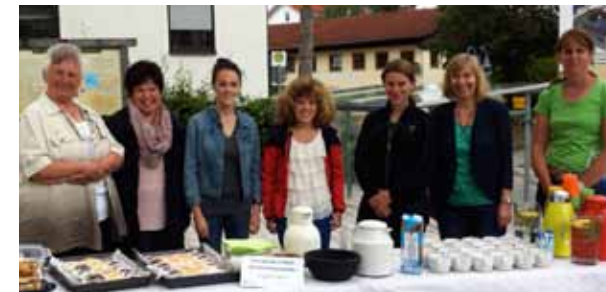
Die fleißigen Helferinnen des Pfarrgemeinderates

Der Pfarrgemeinderat Buchenberg lud bereits mehrmals zum Verweilen nach der Sonntagsmesse ein. Die fleißigen Helferinnen verwöhnten die Besucher nicht nur mit leckeren Blechkuchen, Muffins, Nuss-ecken und herzhaft belegten Brötchen sondern boten auch Kaffee oder einen Becher Minz-Zitronenwasser an.