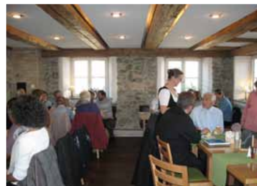
Viele der Besucher gingen anschließend noch mit zur gemütlichen Einkehr in den Gasthof Adler