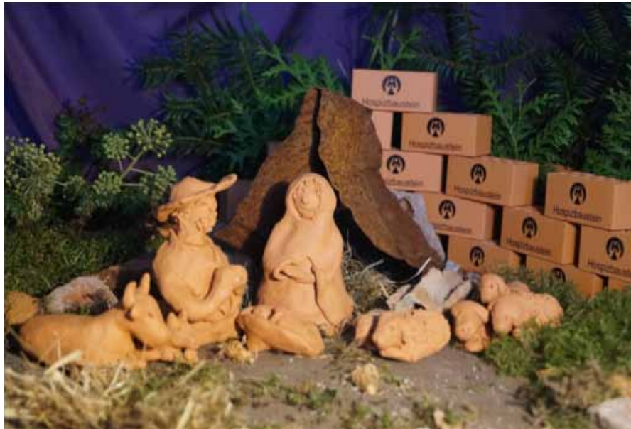
Hospiz – ursprünglich Herberge – bedeutet heute Heimstatt, Begleitung und liebevolle Pflege für den letzten Weg des Lebens. Für dieses Ziel arbeitet die Hospizfamilie, mit viel Herzblut