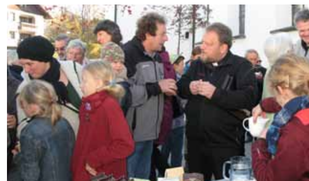
Geselliges Beisammensein nach dem Gottesdienst